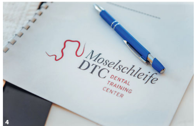
Abb. 3 und 4 Die Laborinhaber bieten Fortbildungen an, zum Beispiel einen Workshop mit ZTM Moritz Pohlig zum Thema „Frontzahnästhetik – Noritake CZR Basics & High Level Keramikkurs“ (Initiator: Kuraray Noritake).